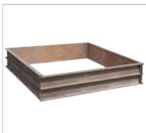
A55N / A56N / A57N / A58N